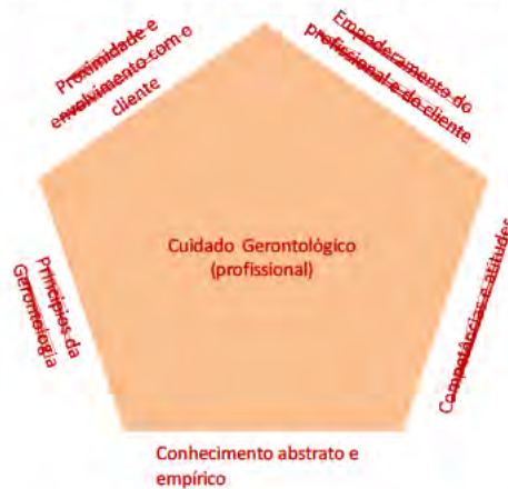
Figura 2 – Diagrama geral do conceito de cuidado gerontológico

Tal como é sugerido pelo diagrama o processo de cuidado gerontológico está referenciado por cinco dimensões: conhecimento abstrato e empírico, competências e atitudes; princípios da gerontologia, proximidade e envolvimento com o cliente; empoderamento do profissional e do cliente. Sem pretender estabelecer qualquer hierarquia definitiva ou rígida sobre a importância destas cinco dimensões, podemos, todavia tentar encontrar uma lógica que afirme e sustente o cuidado gerontológico como um processo socioeducativo.